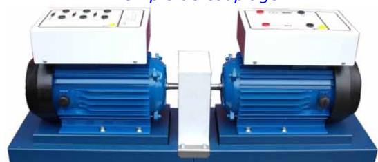
Exemple de couplage